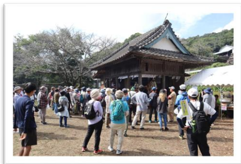
三女神社、餅まきのスタンバイ

去る10月27日(日)、「あじむウォーキング」が開催されました。今年は妻垣神社と三女明神社の秋の大祭を巡る、「一度で二度おいしく大祭をはしごしちゃおう!」というコースを企画しました。心配していた天気にも恵まれ、約60名の参加者が楽しみました。地域の方をはじめとして、宇佐、中津、遠くは国東や別府の方からの参加がありました。妻垣神社の参拝、三女神社での餅まきや恒例の豪華なお接待が行われ、乳不動で史跡のガイドを受けてゴールへ。その後の昼食は菜の花会による秋の味覚満載の健康なお弁当のふるまい、その他にお花の苗のプレゼントもありました。皆さんが健康的に歩きながら、地域の歴史や文化、食に触れる貴重な機会となりました。