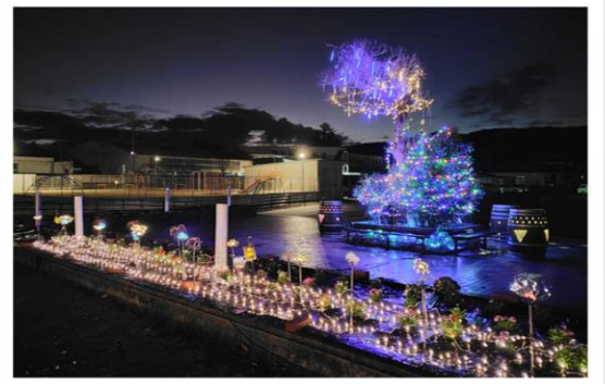
文化会館前の装飾（↑）とクリスマス色満載のだんだんテラス（↓）。映えています！