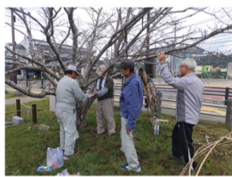
11/17(日) イルミ設置作業

次年度の事業計画の時期となりました。地区でのお困りごと等、まち協で支援できることがあるかもしれません。何かあればご相談下さい。