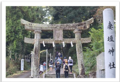
石畳の階段、結構きついです...

去る10月27日(日)、「あじむウォーキング」が開催されました。今年は妻垣神社と三女明神社の秋の大祭を巡る、「一度で二度おいしく大祭をはしごしちゃおう!」というコースを企画しました。心配していた天気にも恵まれ、約60名の参加者が楽しみました。地域の方をはじめとして、宇佐、中津、遠くは国東や別府の方からの参加がありました。妻垣神社の参拝、三女神社での餅まきや恒例の豪華なお接待が行われ、乳不動で史跡のガイドを受けてゴールへ。その後の昼食は菜の花会による秋の味覚満載の健康なお弁当のふるまい、その他にお花の苗のプレゼントもありました。皆さんが健康的に歩きながら、地域の歴史や文化、食に触れる貴重な機会となりました。