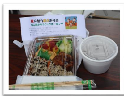
菜の花会の秋のお弁当。ありがとうございました!