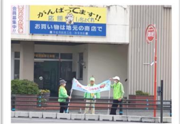
12/17(火) 冬の事故ゼロ運動