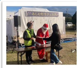
盛況！お楽しみくじ。当選者、おめでとうございます