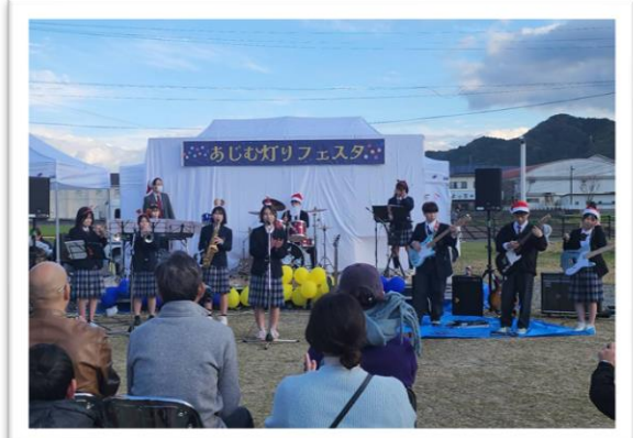
お馴染みのクリスマスソングに体もスイング♪

イベントの最後には、会場の皆さんと一緒にカウントダウンでイルミネーションを点灯。今年は例年の装飾に加え、だんだんテラスにクリスマス仕様のかわいらしいイルミネーションと文化会館前には両院商工会青年部が製作協力した装飾にも灯がともりました（この2カ所は、クリスマスまでの点灯となります）。関係者の皆様の多大なるご尽力により、今回のフェスタが無事に終わることができ心より感謝いたします。