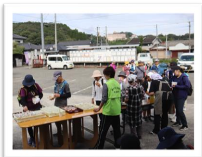
お接待、今年も好評でした