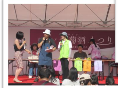
まち協の活動PRでステージ出演

9月28日、29日に開催された葡萄酒まつりには、ステージイベントの提供だけでなく、主催者ブースでかき氷店の出店を行いました。初日の午前中はあいにくの天気で売れ行きが悪く、冷や汗が出そうになりましたが、午後からは天気も回復し、売上に繋がりました。ステージ出演も冷や汗ものでしたが、MCの方に助けられ、無事に終えることができました。初出店でトラブルも多々ありましたが、スタッフの皆さんの知恵と協力で乗り切れた事に感謝します！