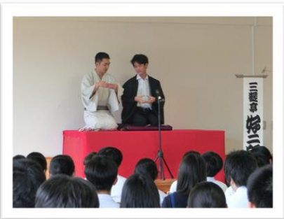
学校寄席で生徒が落語しぐさを体験