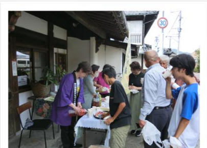
縣屋酒造でお接待

・マイクがいない距離で、看板のピンや禁酒番屋や個性満載の至芸が聞けて楽しかったです。会場も、和気あいあいの雰囲気とても素敵でした。お弁当も美味しかったです。桐呼さんでミニ鍔絵、懸屋さんで焼酎をお土産に、楽しい一日を過ごさせていただいて、ありがとうございました。