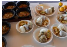
菜の花会による 豚汁とおにぎり弁当