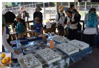
恒例のシャインマスカットに加え、 今回は農泊家庭のお菓子を。紫ジャガ 仔のポテトチップスが大好評！