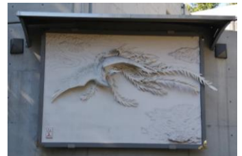
No.78 繰生邸の鰻絵。 素晴らしい！