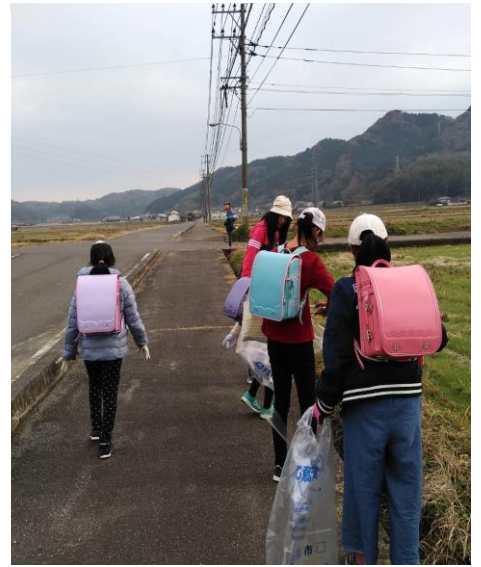
児童達とのクリーン活動風景