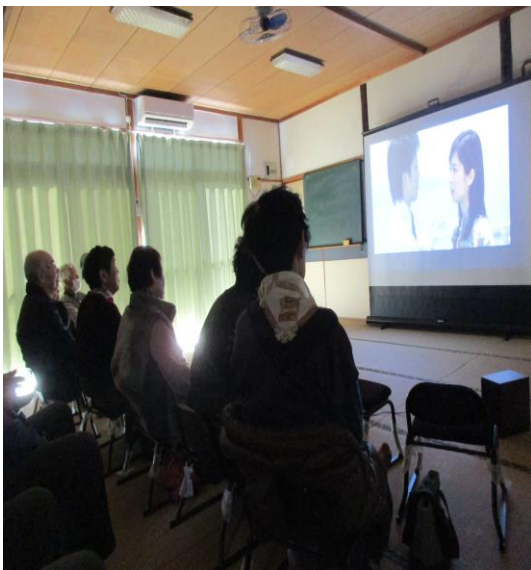
荘出張映画サロン